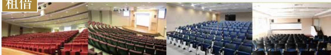
國際會議廳(12,000元起/452人)